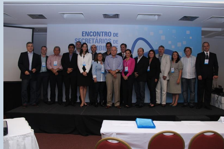
I Encontro do Fórum CB27 – Rio de Janeiro - 2012